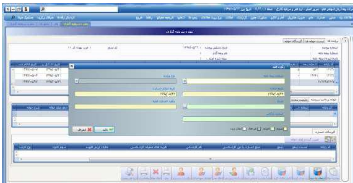
شکل شماره ۱