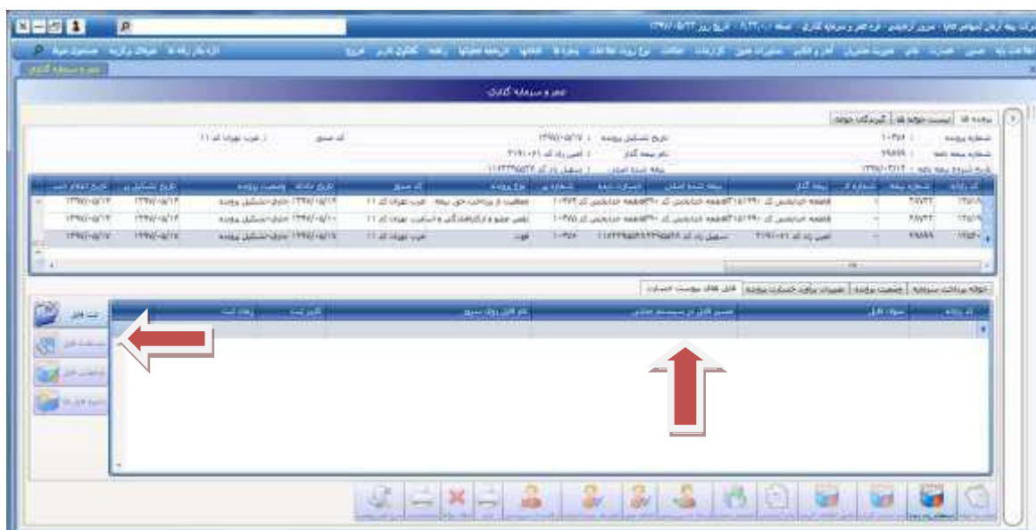
شکل شماره ۲

۴-۱-۵ پس از ثبت فایل در سیستم فناوران، با توجه به اینکه کلیه خسارت‌ها به طور متمرکز در ستاد انجام می‌شود، ضروری است مستندات خسارت از طریق شعبه به دبیرخانه و از دبیرخانه به ستاد مرکزی بیمه‌های عمر و سرمایه‌گذاری ارسال گردد.